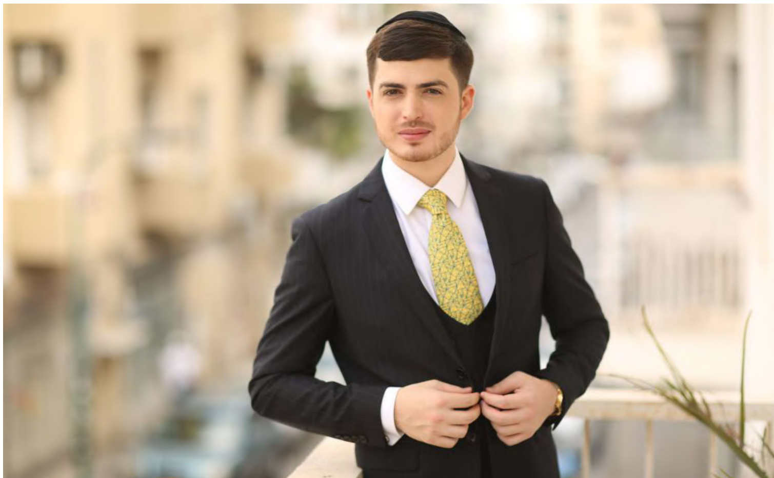
הפידבק מהציבור הוא נותן לי את הכוחות. קליין בצילומים לראיון

קצרה לכך שכולם יבינו שהתפקיד שלי בעולם זה לשמח את עם ישראל דרך שירה וזימרה. ואז יחד עם רצון גדול שלי והשקעה גדולה בלחנים ועיבודים טובים הגעתי לכל מה שאני עושה כיום בזכות אהבת הקהל והסייעתא דשמיא שמלווה אותי בדרכי המוזיקאלית."