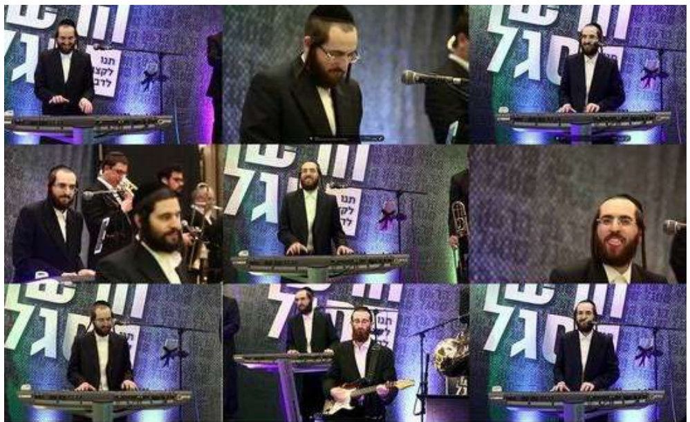
ערב ערב על במות. תיעודים מאירועים של סגל.