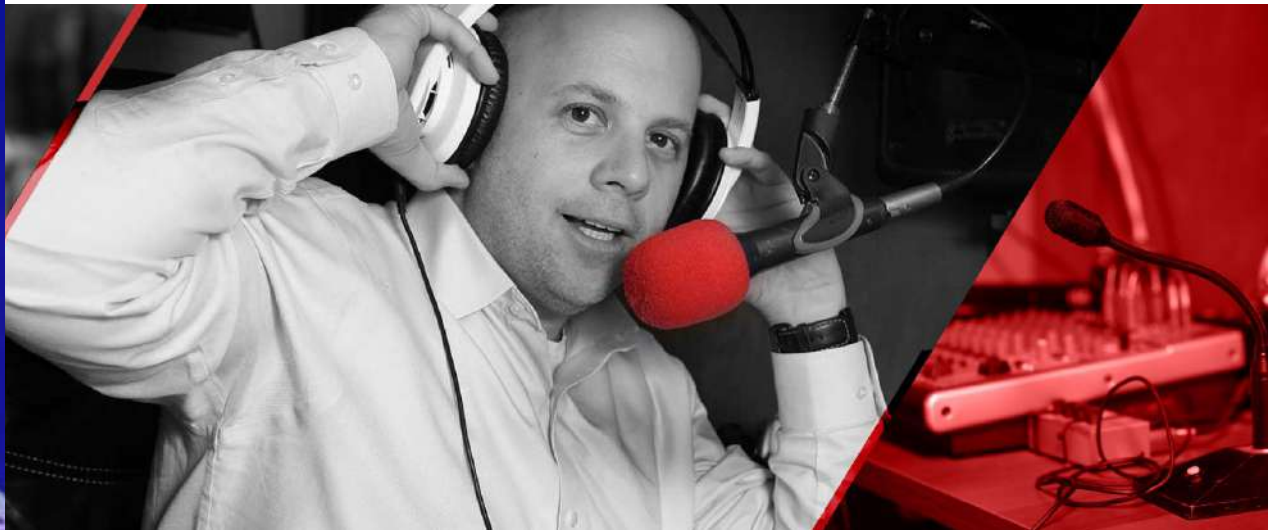
"אני בעצמי לא יודע עד כמה יכול להיות לאדם אנרגיות". טוקר.

"אני בטבעי אדם שאוהב לחדש דברים אני לא אוהב לחקות אף אחד. לעולם לא תשמע אותי מחקה שדרן לא בסגנון ולא במהלך. אני מעריך כל שדרן והסגנון שלו, אבל אני לא אוהב ומעריך בכלל משרדנים שמעתיקים מאנשים אחרים וכמוהם אני גם לא אוהב זמרים ושפים שמעתיקים מהשני כי זה עניין של חוסר מקוריות. וזה מה שטוב כי שאני אוהב תמיד לחדש ולחיות כמה שיותר מקורי."