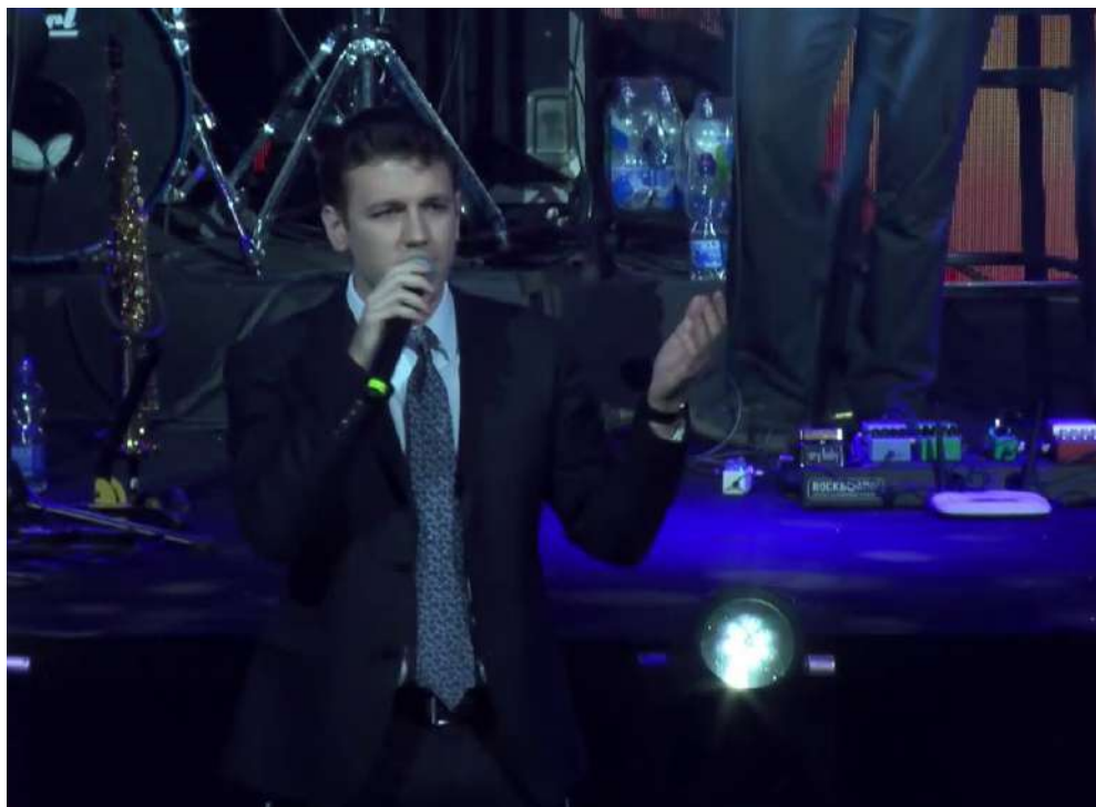
בהופעה בשיתוף 'קול חי מיוזיק'.