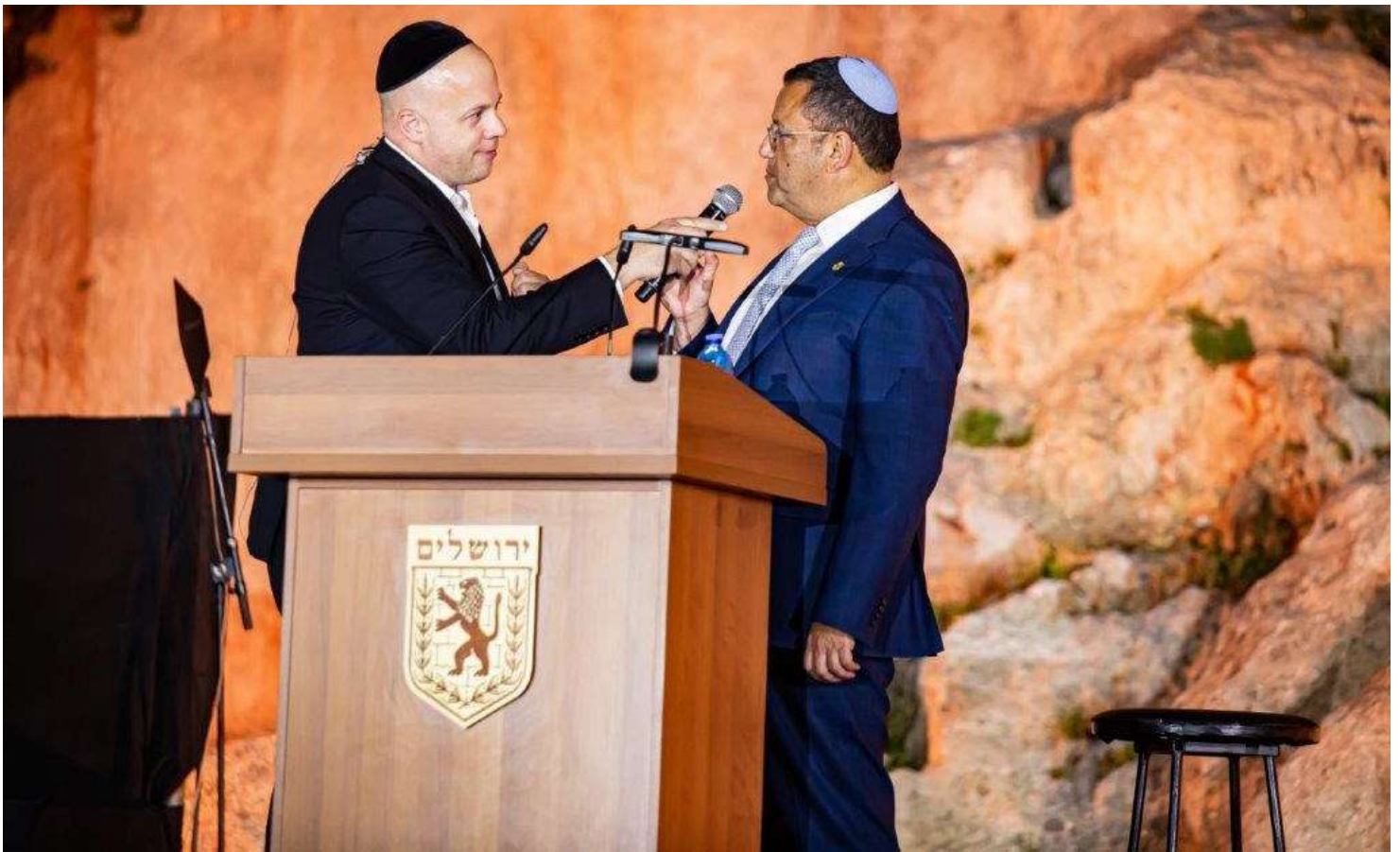
נולדתי עם מקרופון בפה. טוקר עם ראש עיריית ירושלים באחד מההופעות שהנחה