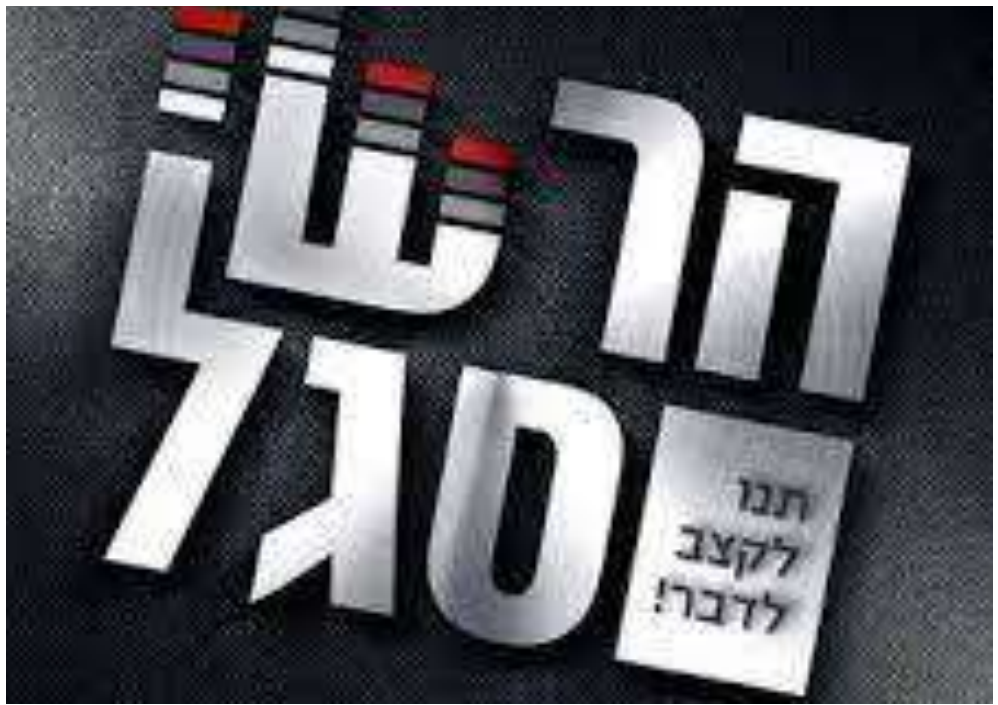
הלוגו היוקרתי של סגל.

"לבקר באומן זה אחד הדברים שקשורים לעולם המוזיקה", אומר לנו סגל, "צריכים להבין, אי אפשר לפתוח מוזיקה מסוימת בלי להבין. אני לא רואה חסיד בעלזא פותח שירים בערבית ומתחיל לשיר ולנגן אותם, לכן אני חושב שרבי נחמן הוא הרב'ה היחיד שיכול לחבר את כולם שבינו בענייני השירה. וכמו שרואים אצלו על הציון בראש השנה שזה הקיבוץ הכי גדול שיש; יש שם ספרדים, ליטאים וחסידים מכל הגוונים והסוגים יש אנשים שלא יקראו לעצמם 'ברסלב' אבל בסוף המוזיקה שאנו מייצרים כיום היא חלק גדול מרבי נחמן מברסלב ומי שרוצה להתחבר למוזיקה אני ממליץ בחום- אומן זה המקום.